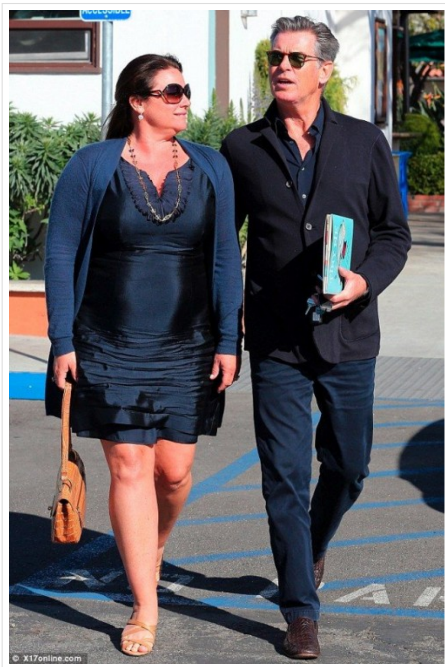
mi idolo Pierce Brosnan con su esposa Kelly

Del mismo modo, dice el trabajo, las mujeres preferimos hombres deportistas y que se les note, léase, el 21% se fija primero en los de aspecto atlético y apenas un 15% en los más voluminosos.